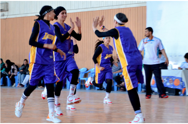
Basketballspielerinnen in Kabul © Sgt. Catherine Threat, Afghanistan 2011

gilt auch als politisches Symbol. Während der 1978 ausgebrochenen „Islamischen Revolution“ wurde er von den UnterstützerInnen des Revolutionsführers Ayatollah Khomeini getragen.