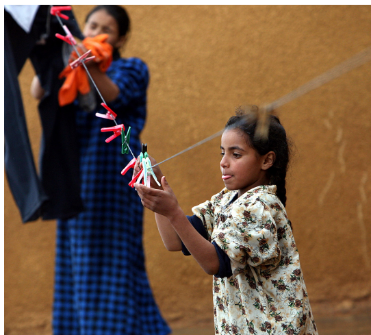
Aufnahme aus einem Flüchtlingslager © Irak-Jordanische Grenze, 2006

In diesen drei Bereichen sind Frauen gegenüber Männern benachteiligt, obwohl sich diese Regelungen auch verändern können. In Marokko gibt es zurzeit ein neues Familienrecht, das die Scheidung für Frauen erleichtert und sie die Kinder behalten dürfen.