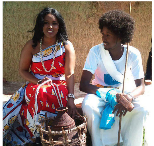
Somalisches Hochzeitspaar

Wenn eine Familie nach Europa flüchtet, ist es für Männer oft sehr schwierig, diese traditionelle Rolle zu bewahren. Sie verstehen die Sprache nicht, finden keine Arbeit und können ihre Familie nicht versorgen.