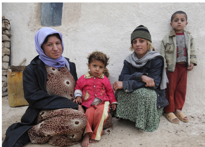
Irakische Familie © 2009

Einige Gründe sprechen jedoch für die Polygamie. Die Ehe mit der ersten Frau kann z.B. kinderlos bleiben oder die Frau kann krank werden. Zudem können Männer ihre erste Ehefrau meistens nicht auswählen, da die Ehen von den Familien arrangiert werden. Das kann auch ein Grund dafür sein, dass die Männer später eine selber gewählte Frau heiraten. Nach dem Tod ihres ersten Mannes, wird von Frauen häufig erwartet, noch einmal zu heiraten. In Afghanistan heiraten Witwen, nach der Tradition des sogenannten Levirats, den Bruder ihres verstorbenen Ehemannes. Wenn dieser bereits verheiratet ist, dann bekommt er eine zweite Ehefrau. Im Krieg hat sich die Anzahl der Witwen und damit der polygamen Ehen deutlich erhöht.