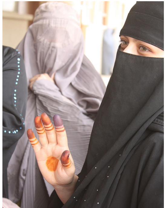
"An Afghan woman decorates her hand to hide the ink stain indicating she has voted, which could put her at risk from Taliban retribution"

* Die Burka ist ein Ganzkörperschleier. Vor dem Gesicht gibt es nur ein Netz, sonst bedeckt diese Kleidung den ganzen Körper. Diese Variante hat das Taliban-Regime in Afghanistan als einzig erlaubte Frauenbekleidung in der Öffentlichkeit vorgeschrieben. Auch nach der Aufhebung des Gesetzes unter der neuen Regierung in den 2000er Jahren tragen weiterhin viele Frauen in Afghanistan und in einigen Teilen von Pakistan die Burka. Sie ist in Europa nicht weit verbreitet und wird in der alltäglichen Sprache oft mit dem Niqab verwechselt.