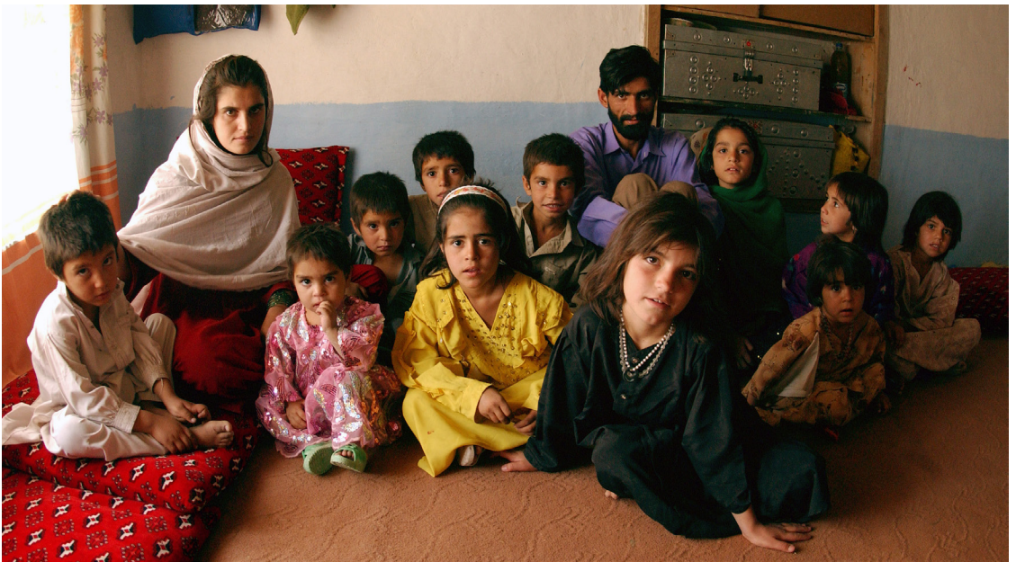
Familie in Kabul

auch die Anzahl der verlobten Minderjährigen, da Eltern die Zukunft ihrer Töchter sichern wollen. Traditionellerweise wird für den Sohn die „parallele Cousine“ als beste Ehepartnerin gesehen, auch wenn die Braut gegebenenfalls älter ist als der Bräutigam. Unter „paralleler Cousine“ versteht man die Tochter des Onkels väterlicherseits.