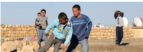
© Dürzan cîrano [CC BY-SA 4.0], 2014

Die große Reise (2004, Regie.: Ismaël Ferroukhi)